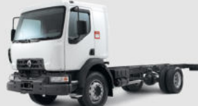
TRUCKS D RANGE